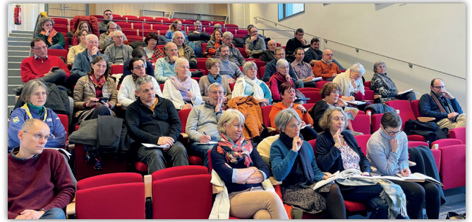
Session du conseil diocésain de pastorale à la basilique du Sacré-Cœur 4 février 2023

Très encouragé depuis le concile Vatican II, il est mis en place à l'initiative de l'évêque. Son équivalent en paroisse est le Conseil pastoral paroissial, lui-même vivement encouragé pour vivre la synodalité en paroisse.