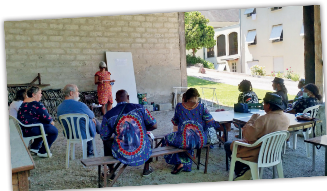
Conseil de la diaconie - 13 juin 2021

Le conseil presbytéral a une mission de conseil auprès de l'évêque et sa voix est « consultative ». Pour certaines grandes décisions, l'évêque est obligé par le droit de l'Église de le consulter. Le but de ce conseil est de faciliter la communication entre l'évêque et l'ensemble des prêtres du diocèse.